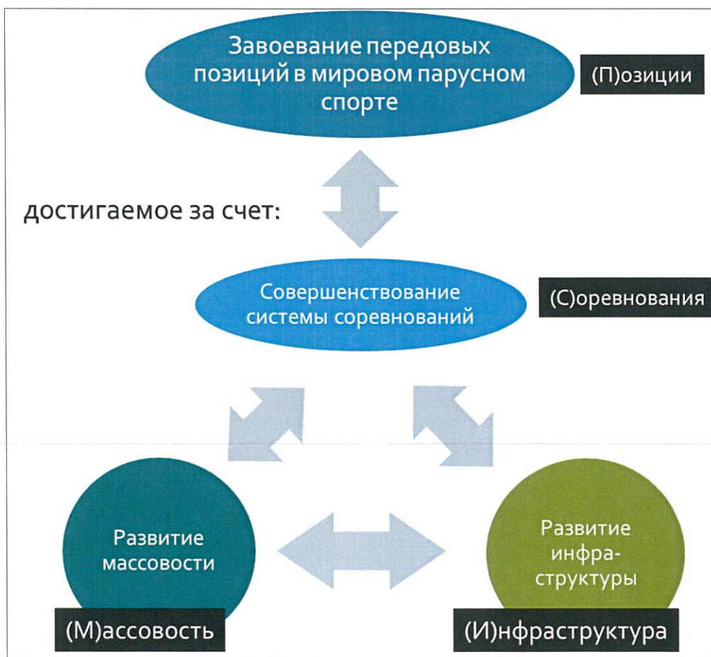
Рис. 1 – цели программы:

Наглядно цели программы и их взаимосвязь приведены на рис. 1.