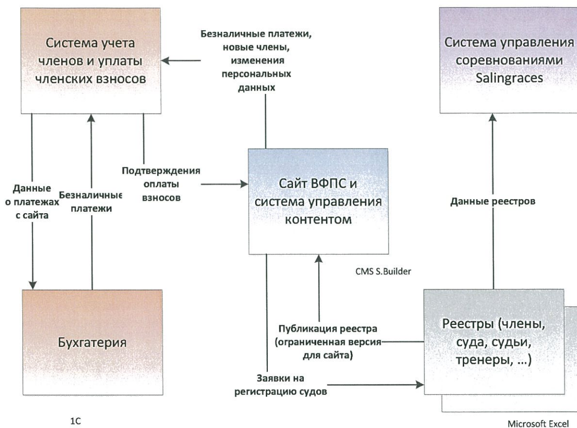
Рис. 1-1 Существующие информационные системы ВФПС

Различные реестры ведутся на локальных компьютерах ответственных лиц с периодическим их копированием на общее файловое пространство (MS SharepointServer), что может приводить к потере актуальности данных.