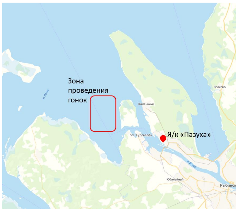
Схема расположения дистанции:

10.2. Гоночные дистанции будут описаны в Гоночной инструкции и будут располагаться на акватории Рыбинского водохранилища, западнее острова Юршинский.